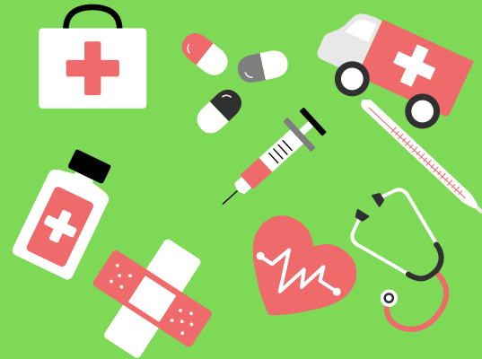
TABELA 2019/1 PLANO DE SAÚDE